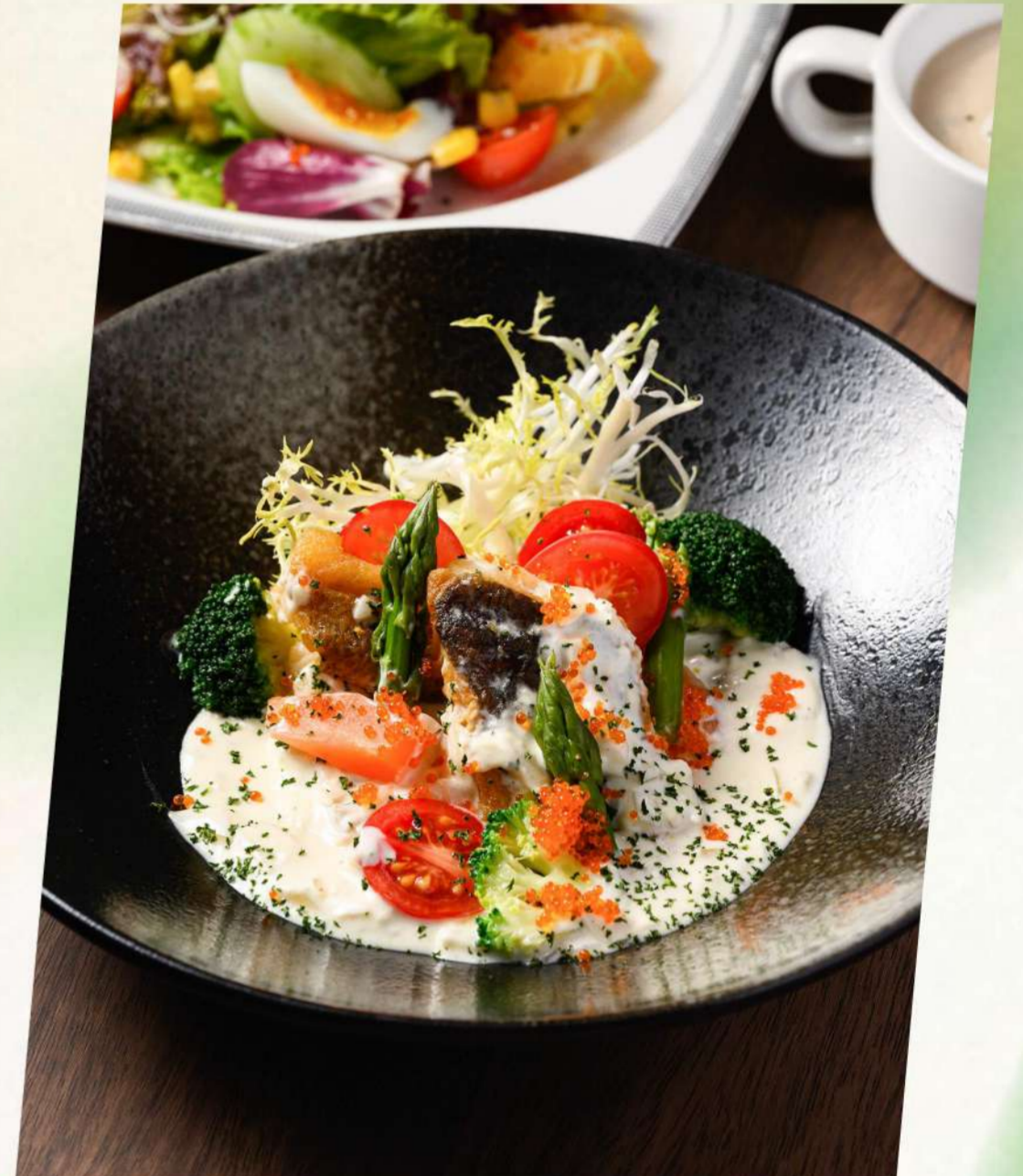
煎比目鱼 白葡萄酒奶油风味 Sautéed Flatfish with white wine cream sauce ヒラメのソテー 白ワインクリームソース