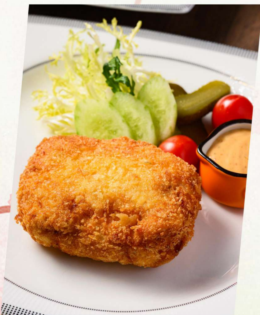
法式蓝带鸡扒 Chicken cordon bleu 鶏胸肉のハムとチーズの挟み揚げ