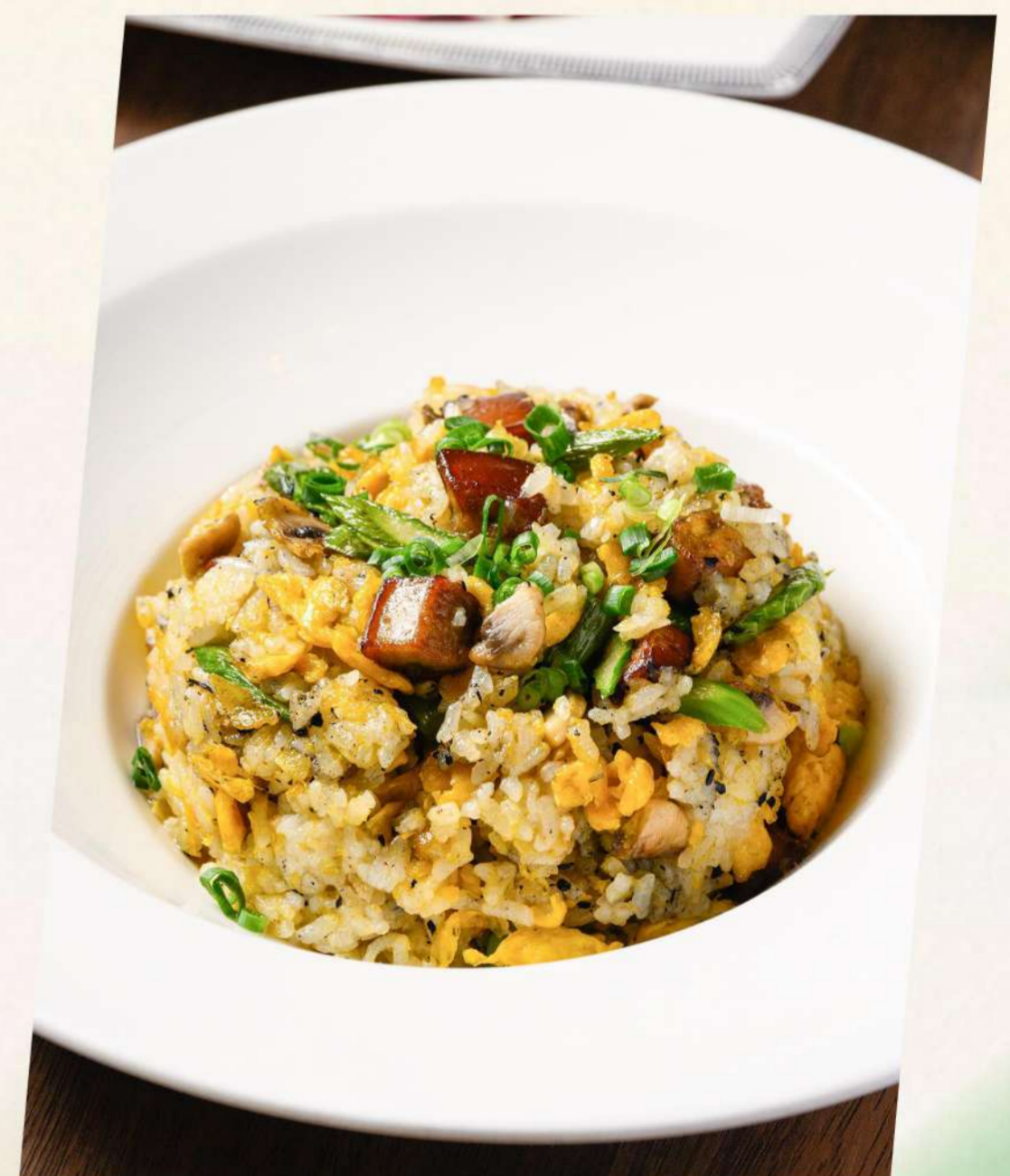
鹅肝炒饭黑松露风味 Fried rice with goose liver black truffle flavor フォアグラ入り黒トリュフ風味炒飯