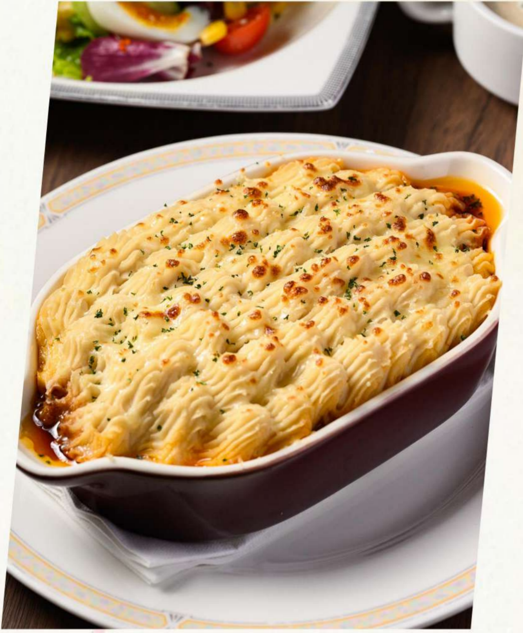
土豆泥焗牛肉法式田园风 Baked beef with mashed potatoes 牛肉とマッシュポテトのオープン焼き