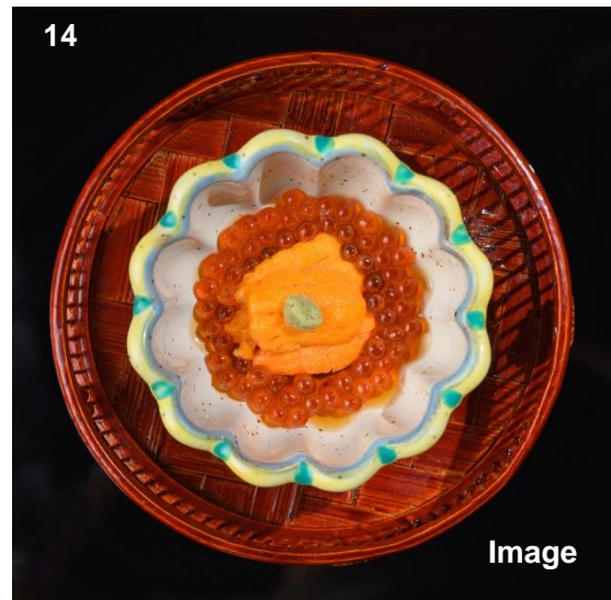
▲ 生海胆配三文鱼子