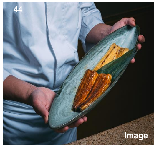
▲酒糟烤或盐烤银鳕鱼