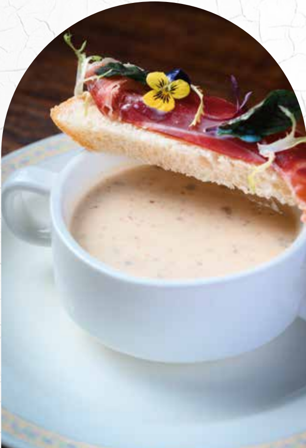
意大利红汤配蒜香面包 Minestrone Soup with Garlic Bread ミネストローネ