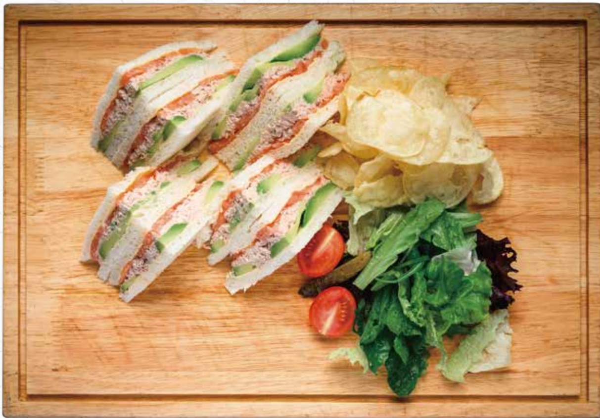
金枪鱼牛油果三明治(白面包或麦麸面包) Tuna and Avocado Sandwich(White or Rye Bread) ツナ サンドイッチ(食パン or ライ麦パン) 78元